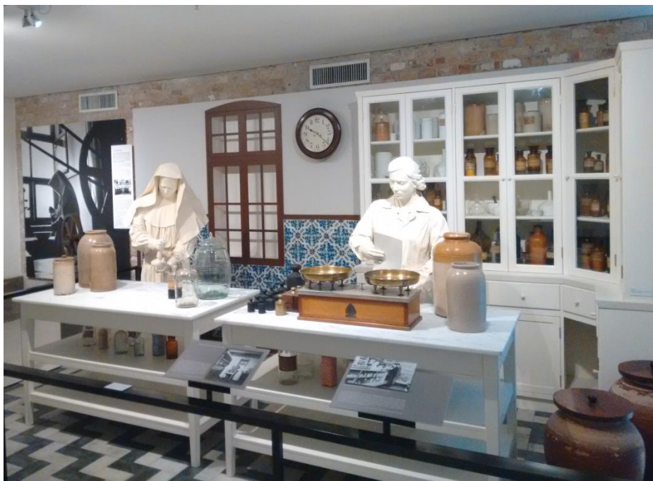
FIGURA 3: Cenografia da Farmácia da Santa Casa

Na Santa Casa, as irmãs franciscanas, vindas da Alemanha, se inserem no trabalho de farmácia por volta de 1890, e durante quase 100 anos foram responsáveis pela organização do hospital. Estas moças tinham formação em farmácia e enfermagem e também faziam parte de congregações religiosas; conquistaram espaço na instituição, ganhando autonomia nas suas áreas de trabalho. Elas estão representadas na exposição por meio de cenografia (Figura 3).