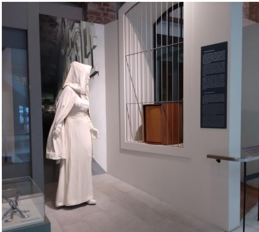
FIGURA 2: Cenografia da Roda dos Expostos

O segundo objeto gerador é, na verdade, o conjunto cenográfico da Roda dos Expostos da Santa Casa ou Roda dos Enjeitados, fazendo alusão ao abandono de crianças (Figura 2). Este recurso foi construído por volta de 1840, sendo instalada em uma janela do Hospital Santa Casa de Misericórdia de Porto Alegre. Durante 102 anos, recebeu crianças abandonadas por famílias que chegavam à instituição, principalmente por três motivos: questões financeiras – não tinha condições de manter o recém-nascido; questões sociais – um filho fruto de adultério, uma mulher violentada ou uma mãe solteira; questões de saúde – com o intuito de esconder a gravidez muitas moças utilizavam espartilhos apertados, em consequência poderiam dificultar o crescimento e formação do bebê e, além disso, neste período, sem os serviços hospitalares de uma maternidade, a maioria das mulheres estava realizando seus partos em casa, ocorrendo comumente algumas complicações que ocasionavam no adoecimento da mãe ou do bebê. Entretanto, esta mediação propunha também alertar os casos de abandonos paternos, que fizeram parte da maioria, senão, de todas as crianças deixadas na roda.