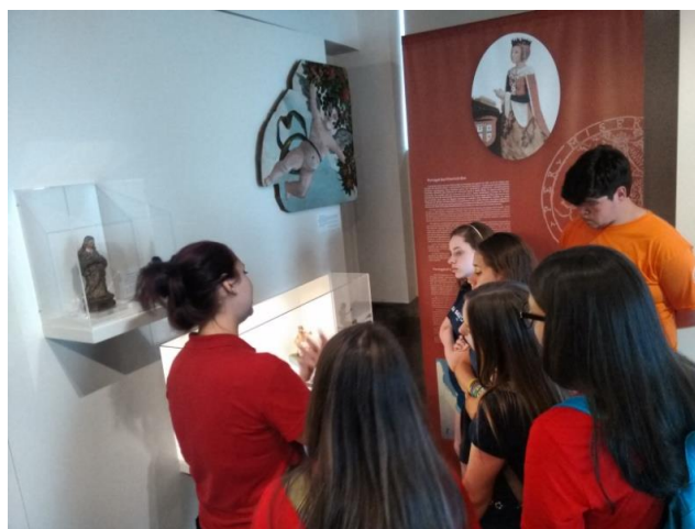
FIGURA 5: Visita Mediada a Exposição de longa duração.

Depois da sessão de vídeo, o grupo foi convidado para realização da mediação no pavimento térreo da exposição, onde foi dado ênfase aos objetos geradores (Figura 5). As três autoras realizaram uma mediação compartilhada, cada uma dando ênfase a um objeto gerador. Durante a mediação houveram questionamentos feitos pelos visitantes. Ao final da mediação no pavimento térreo, foi explicado que voltaríamos à sala, para realização da oficina. Na sala, separamos o grupo em dois trios, sendo que em um dos trios estava presente o assessor, e novamente não utilizamos a caixa 3 – trabalho, pois tínhamos um número pequeno de pessoas participando da atividade.