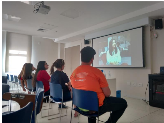
FIGURA 4: Sessão de vídeos sobre Violência Contra a Mulher.

breve apresentação e a introdução dos assuntos que iríamos trabalhar na mediação e oficina, respectivamente: violência contra a mulher, abandono de crianças, e o trabalho. Para iniciação passamos um vídeo editado pelas autoras, com a duração de 10 minutos.