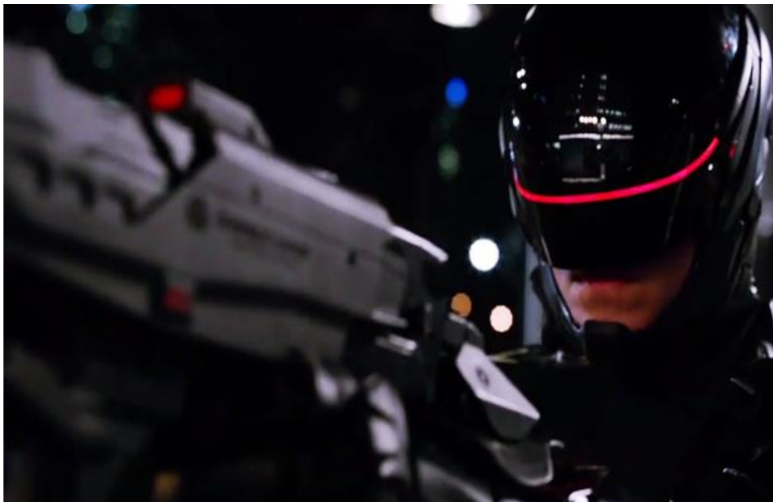
Figura 3: Imagem do RoboCop refilmado.

A refilmagem recente de RoboCop (2014) foi dirigida pelo brasileiro José Padilha, em que algumas premissas são mantidas, porém o policial Murphy não morre totalmente e tem implantado em seu cérebro chips de comandos, incluindo sua cabeça, coração e pulmões que sobram e são incorporados na estrutura cibernética atualizada que o transforma num humanóide ciborgue (Fig. 3), porém as ironias foram excluídas.