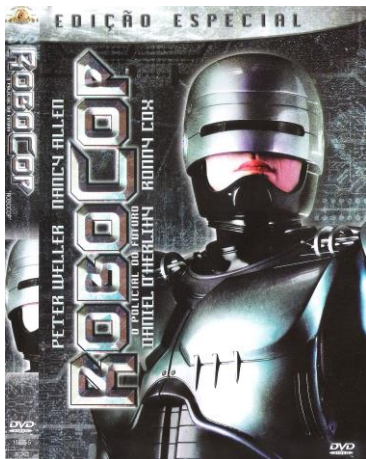
Figura 2: Capa do DVD de RoboCop original.