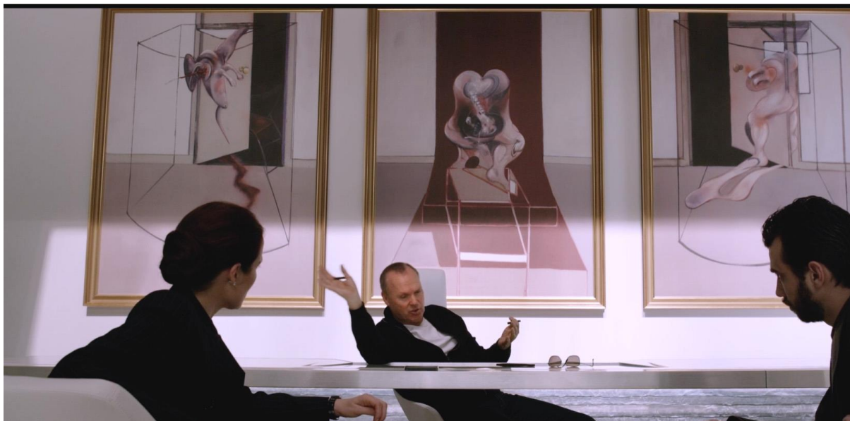
Figura 5: Imagem do filme em que se vê na parede ao fundo da sala do dono da OMNI CORP o tríptico de Francis Bacon “Trilogia Oresteia”