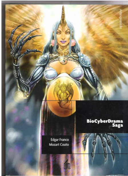
Figura 4 : Capa de BioCyberDrama Saga.

si mesmas modificando suas estruturas genéticas ou transplantando suas consciências em máquinas humanóides mesclando-se com outras formas lendárias como centauros etc.